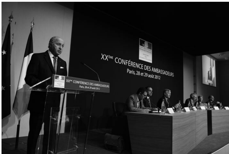
Laurent Fabius à la conférence des ambassadeurs, du 27 au 29 août à Paris.