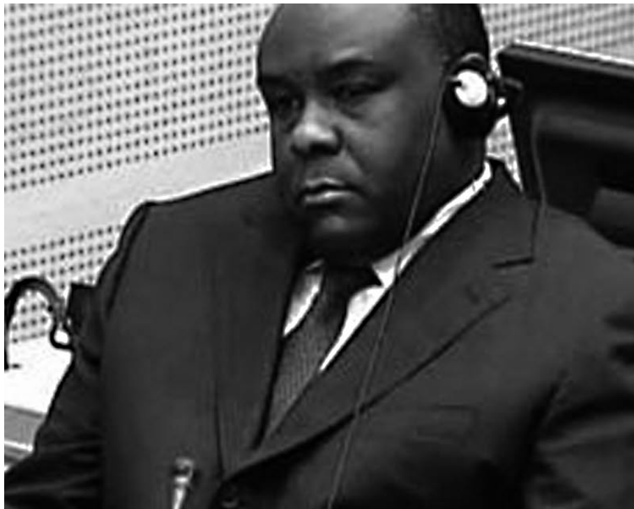
Ancien candidat à l'élection présidentielle congolaise de 2006, Jean-Pierre Bemba devant les juges de la Cour pénale internationale

La défense de Bemba a, en effet, entamé la présentation de son dossier devant la CPI cherchant à prouver que l'accusé n'avait pas le contrôle direct de sa milice, le Mouvement de libération du Congo (MLC). C'est le général français, Jacques Seara, qui a ouvert le bal des 63 témoins de la défense en affirmant que l'accusé ne pouvait exercer de commandement sur ses hommes déployés en République centrafricaine. Officier retraité de l'armée française, le général de brigade témoignait en qualité d'expert et auteur d'un rapport sur la structure de commandement des forces armées lors du conflit en Centrafrique. Seara a dirigé le bureau des relations internationales de l'armée de terre et, à ce titre, était en relation avec toutes les armées étrangères comme il l'a expliqué à la Cour. Il a assuré que « le commandement des opérations pendant toute la durée du conflit était centrafricain ». Il a précisé qu'« on ne peut pas imaginer dans ce type de conflit qu'un élément travaille en électron libre » (!), en ajoutant, au sujet du MLC,