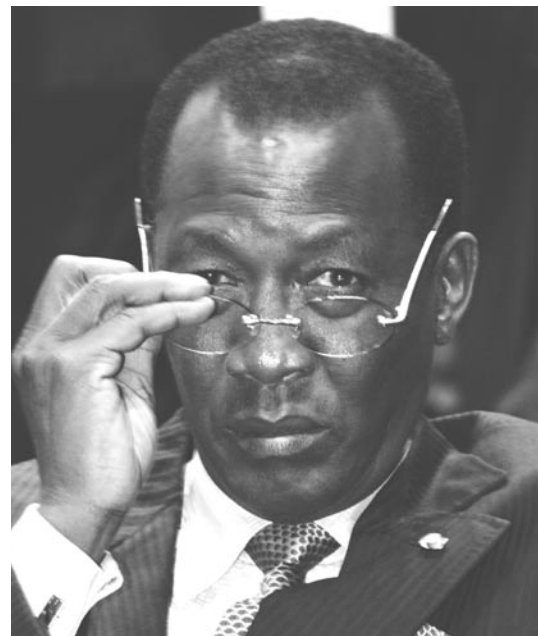
Idriss Déby offre des soldats pour combattre au Niger afin de s'assurer une immunité.