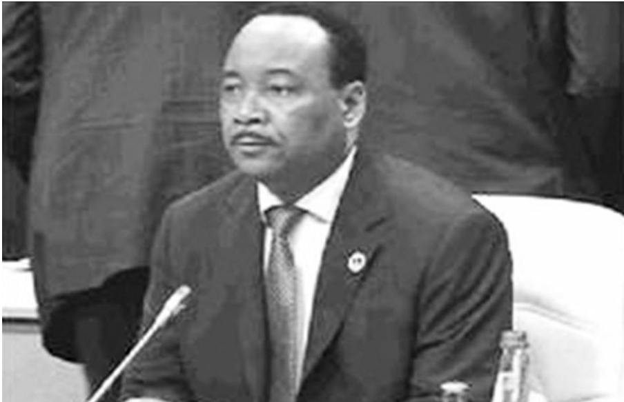
Mahamadou Issoufou tient à ce que le démarrage du projet Imouraren d'Areva débute avant la prochaine élection présidentielle.