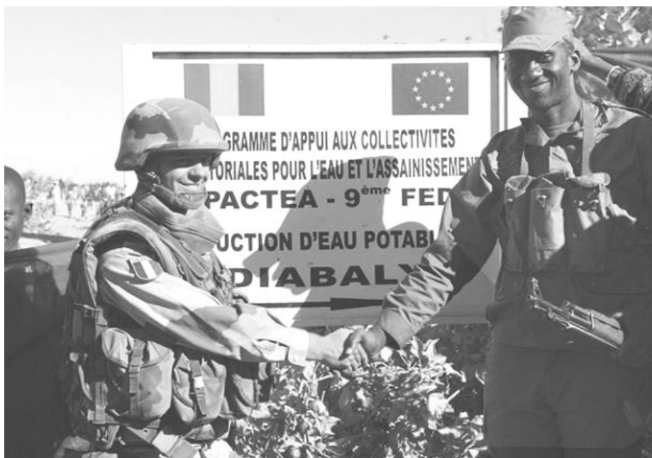
Militaires français et maliens posant devant l'entrée de la ville de Diabaly