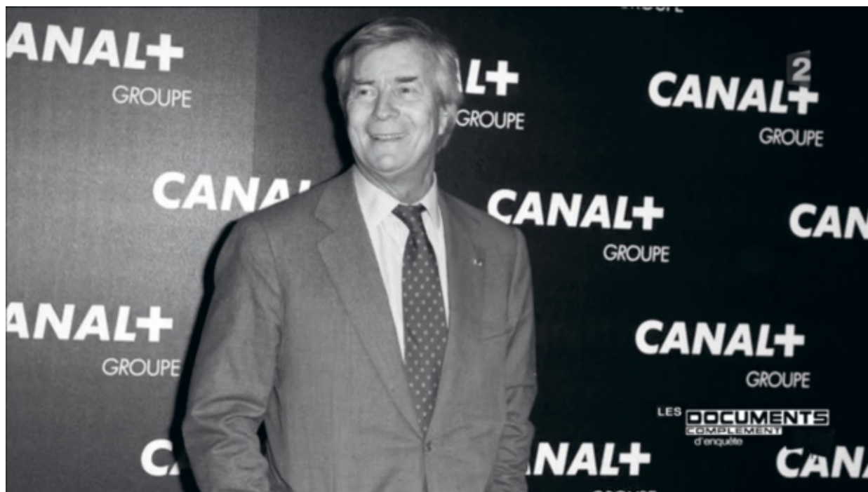
Vincent Bolloré lors de sa prise de contrôle de Canal+, extrait du reportage Complément d'enquête. Bolloré, un ami qui vous veut du bien? de mars 2016 diffusé sur France2.