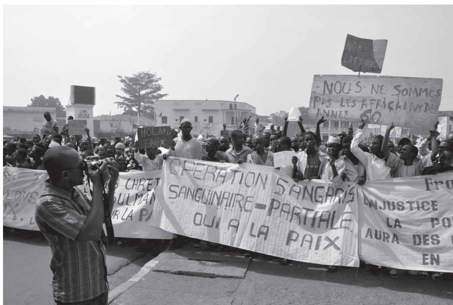
L'opération Sangaris est pointée du doigt pour son inaction face aux massacres de musulmans.