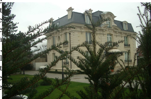
Villa Suzette (Le Vesinet)

De plus, si on se réfère au travail accompli par des citoyens congolais sur les biens mal acquis « des nouveaux riches congolais », on découvre que beaucoup de ses proches possèderaient des propriétés dans la région parisienne. Ainsi, son neveu Wilfrid, qu'il a nommé conseiller politique et qui dirige la société congolaise des transports maritimes (Socotram), posséderait un appartement de 550m 2 avec une belle terrasse de 100m 2 . Le neveu du président congolais aurait aussi un faible pour les voitures de luxe : Porsche, Mercedes, BMW, Jaguar et une Aston Martin DB9 auraient leur place dans les sous-sols de l'immeuble. 355 Le frère du président, PDG d'une compagnie pétrolière Likouala SA, plusieurs fois mise en cause par la justice, posséderait une propriété à Argenteuil. Son neveu, directeur du domaine présidentiel, posséderait un bel appartement dans le 16 ème arrondissement à Paris. La liste est longue et hormis la famille de Sassou-Nguesso, elle révèle de nombreux biens au Congo ou en France, détenus par l'entourage du président congolais et des hauts fonctionnaires congolais.