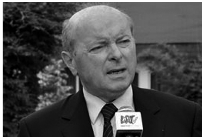
Jacques Toubon : « Une décolonisation qui s'est faite par consentement mutuel »

Ainsi, la mission officielle de Jacques Toubon, le « secrétariat général du cinquantenaire des indépendances africaines en 2010 », qui n'est pas sans rappeler le secrétariat général pour les affaires afri-