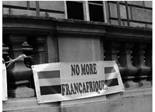
Manifestation à Londres pour protester contre le coup d'Etat électoral d'Ali Bongo

Dans les consulats du Gabon à l'étranger, aucune liste électorale n'avait été publiée à la date du 23 août soit six jours avant le scrutin (alors qu'un recours éventuel demande huit jours) ! Aucune nouvelle carte électorale n'a également été distribuée, ce