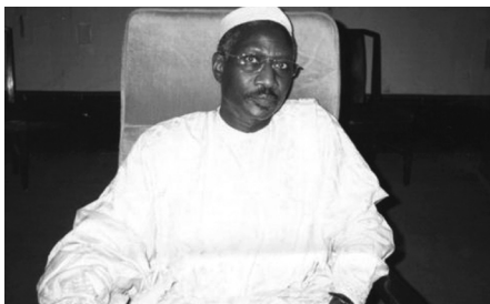
Ibni Oumar Saleh disparu en 2008