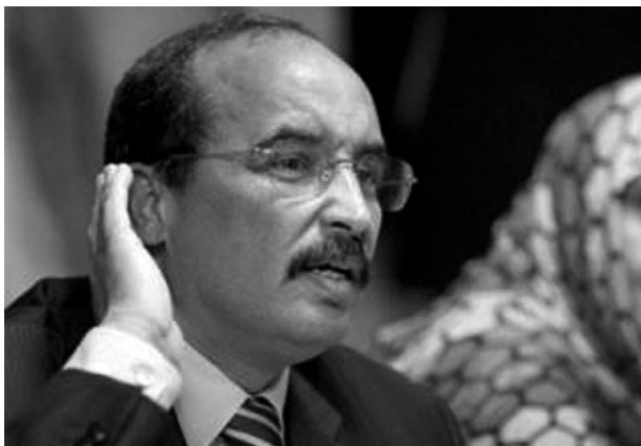
Le général putschiste Mohamed Ould Abdel Aziz, sourd aux critiques de l'opposition

Toutefois, alors qu'une délégation du Parlement européen avait appelé au dialogue entre les deux parties pour sortir de la crise politique, Abdel Aziz a répondu par l'invective, accusant l'opposition de « négliger les intérêts de la Nation, de défendre les prévaricateurs et de freiner