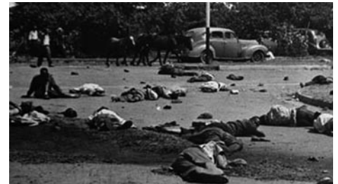
21 mars 1960 Massacre de Sharpeville