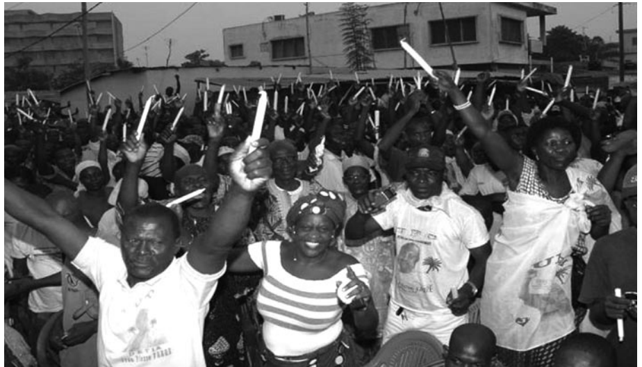
« Gamé sou lo ! », scandent les militants. « Il est l'heure ! ». L'heure de marcher pour contester les résultats annoncés la veille.

Pendant près de quarante ans, le sergent-chef Eyadéma, devenu général d'armée à la suite de diverses métamorphoses, s'est chargé de liquider, au propre et au