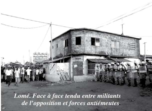
Lomé. Face à face tendu entre militants de l'opposition et forces antiémeutes.

Une élection financée par l'Union européenne. Les résultats sont tombés, conformes à ceux qui l'ont précédée depuis 1990.