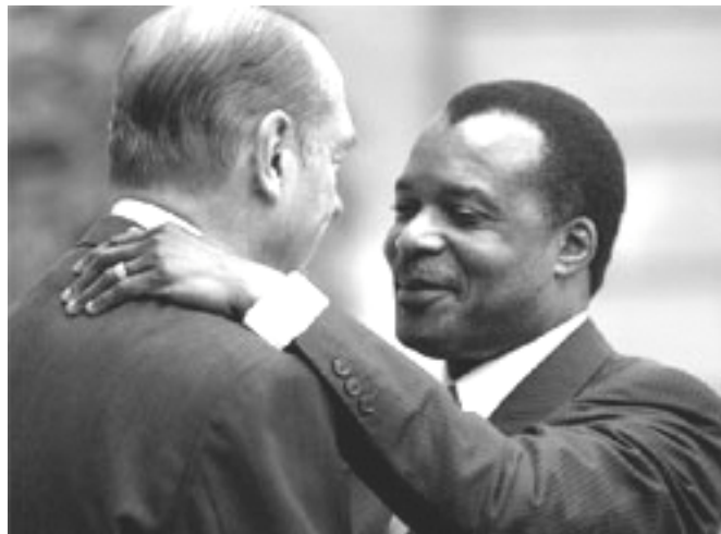
Denis Sassou N'Guesso, de passage à Paris, a été reçu chaleureusement par Jacques Chirac à L'Elysée le 12 septembre.