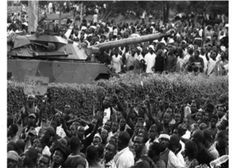
Hôtel Ivoire, novembre 2004, les blindés français face à la foule de manifestants.