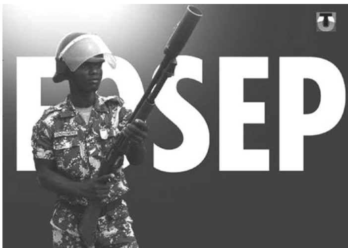
Force Sécurité Election Présidentielle », la FOSEP, 6000 policiers et gendarmes togolais formés par la coopération française.

coopération internationale doit toujours être plus performante », (Frères d'Armes n°258, 2008). Si le contexte est complexe, la pensée reste très simpliste.