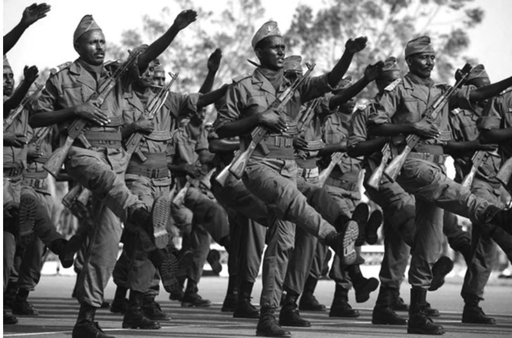
Plusieurs officiers de l'Armée nationale djiboutienne, écrivant sous le sceau de l'anonymat, affirment leur intention de protéger la population et de soutenir ses revendications légitimes.

Djibouti est souvent cité comme le pays d'Afrique qui reçoit directement et indirectement l'aide par tête d'habitant la plus élevée (Union européenne, FMI, Banque mondiale, USAID, fonds arabes). A cela il faut ajouter les 30 millions d'euros annuels versés par la France au titre du loyer pour sa