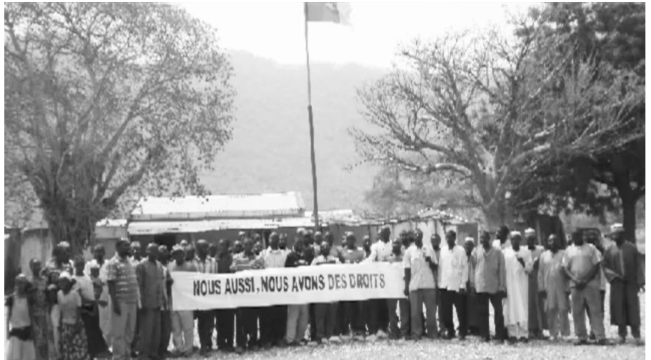
Les habitants de Bidzar protestant contre les dommages causés par l'exploitation des carrières de Cimencam

Depuis 2011, la Cellule de veille et protection des victimes des activités minières de l'arrondissement de Figuil, fédère les habitants pour défendre leurs droits. Dans une vidéo et diverses alertes relayées par la presse camerounaise, l'association dénonce notamment le taux élevé de maladies respiratoires constaté dans la population exposée aux poussières des carrières et aux fumées de l'usine. L'exploitation entraîne également la destruction de terres agricoles et du couvert forestier dont les populations tiraient des ressources essentielles. D'après la Cellule, un