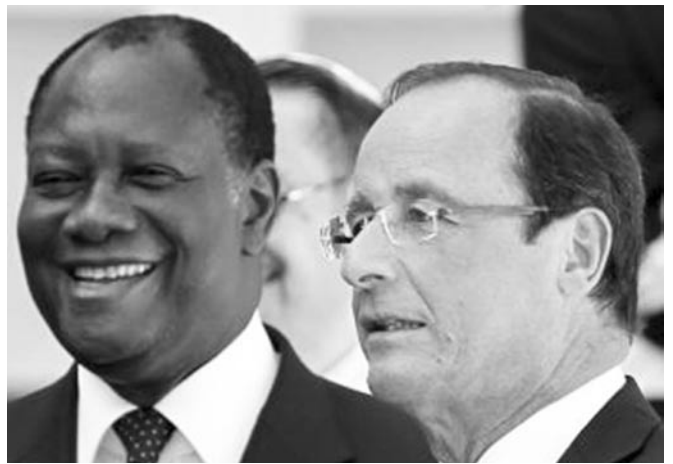
Hollande « a salué l'implication personnelle du président ivoirien dans la restauration de la sécurité sur l'ensemble du territoire ainsi que dans la réforme de l'armée »

Quant au volet purement franco-ivoirien de la crise démarrée en 2002, la télévision publique italienne en a donné une nouvelle lecture fort intéressante avec la diffusion de « La Francia in nero » (RAI3, 13