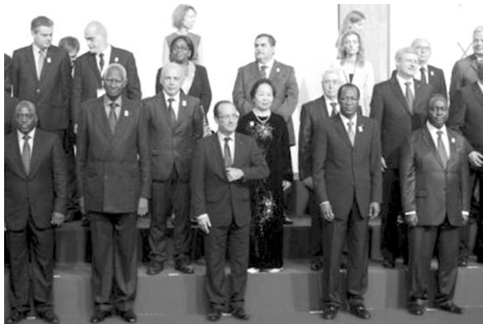
La photo officielle du quatorzième sommet de la francophonie à Kinshasa