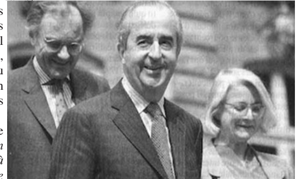
Le gouvernement Balladur, artisan de la dévaluation du franc CFA en 1994. Michel Roussin, ministre de la Coopération parlera de « nouveau départ »

Les avantages des Africains sont théoriques. La « garantie illimitée » est une pure hypothèse d'école. La France garantit les achats en cas de manque de devises de