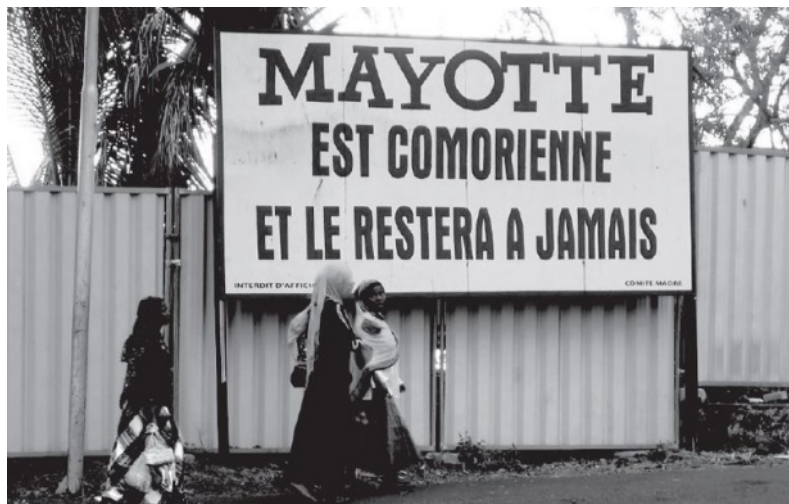
Rue centrale, à Moroni, Grande Comore, 17 novembre 2013.

Boucs émissaires pour les maux dont ils/elles ne sont aucunement responsables, les « migrant-e-s » qui survivent à Mayotte, victimes du racisme d'État, ont été aussi parmi les principales victimes du cyclone. Ce sont les bidonvilles qui ont été les plus touchés : les maisons en tôle, mais aussi leurs habitant-e-s (dont beaucoup en situation irrégulière), qui n'ont pas pu, par manque d'information, rejoindre les abris en dur proposés par l'État. Ou pas voulu « de peur de se faire contrôler et